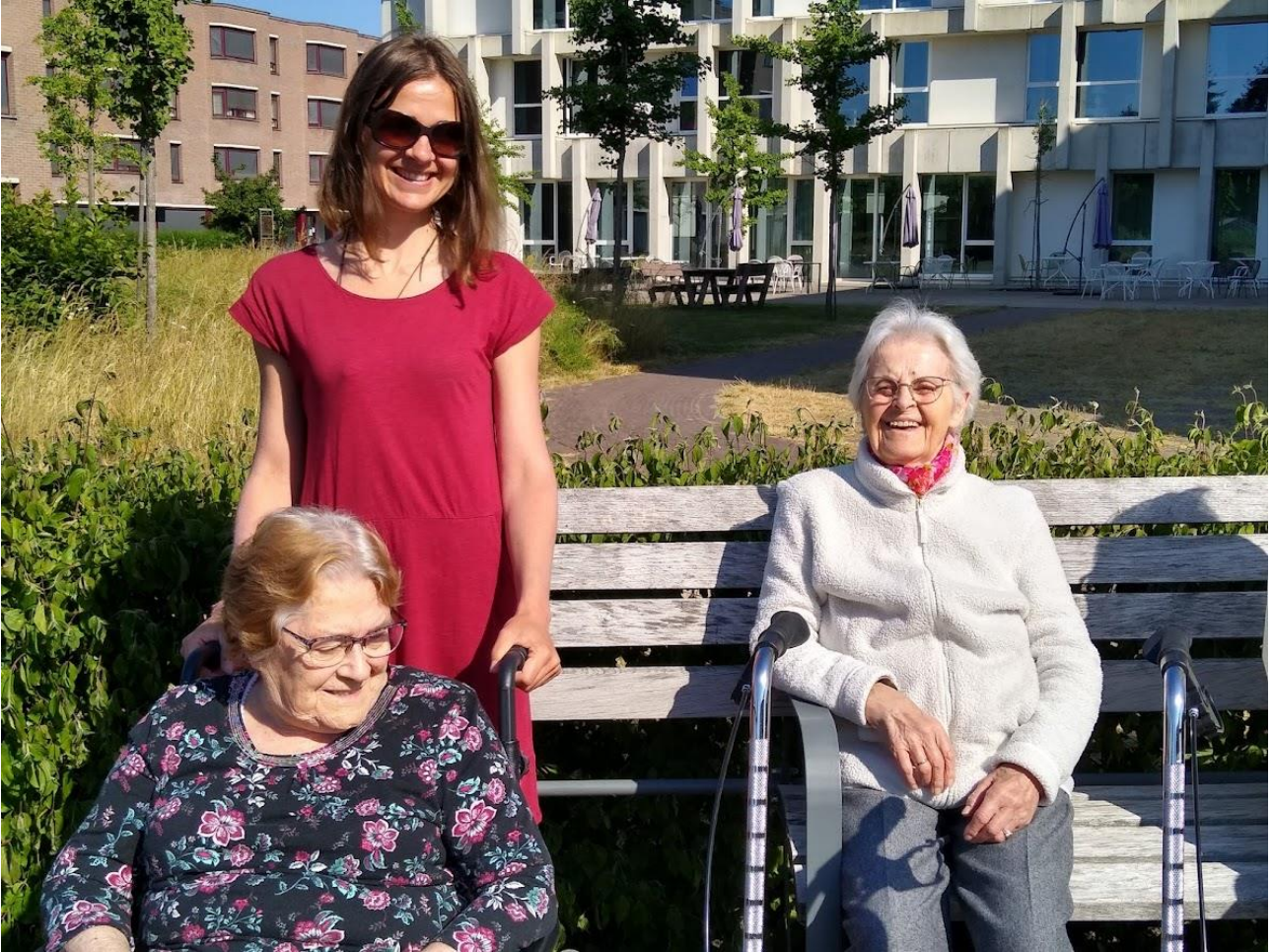
De Wending verdiep 2 genieten samen van de zon en de tuin