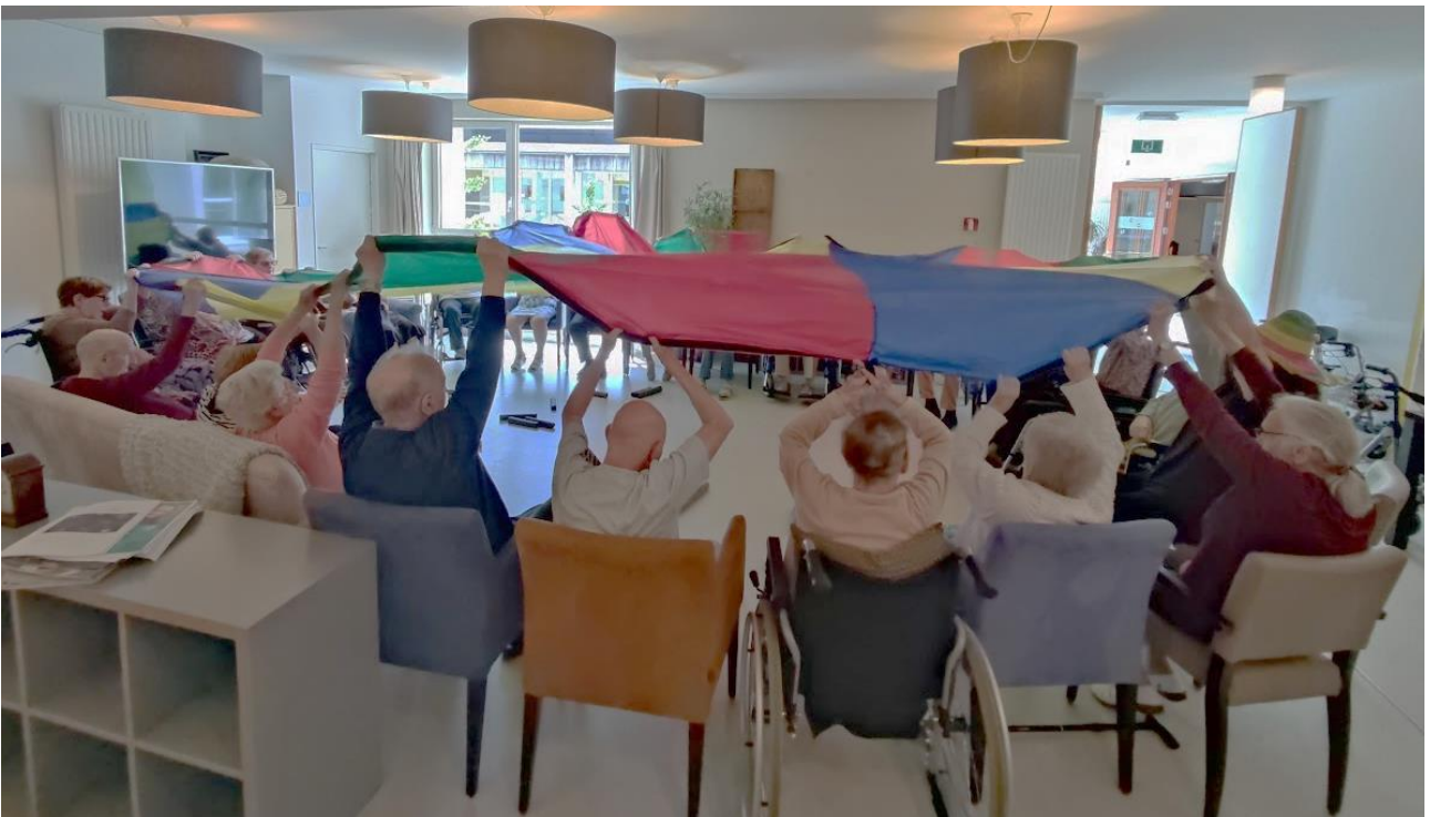
De Wending verdiep 3 omhoog- omlaag en waaien maar